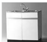
38051 Mietspüle (Abbildung ähnlich)

Bitte beachten Sie beim Einsatz von Gewerbespülmaschinen: